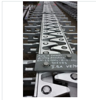
Staalconstructie af fabriek