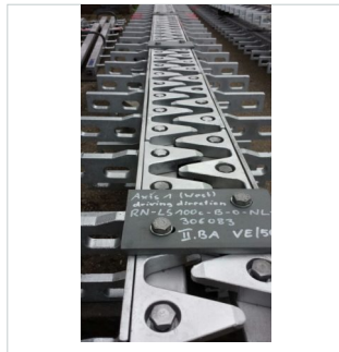
Staalconstructie af fabriek