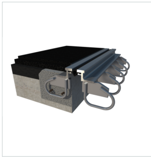
SN ESV-N1 Impressie