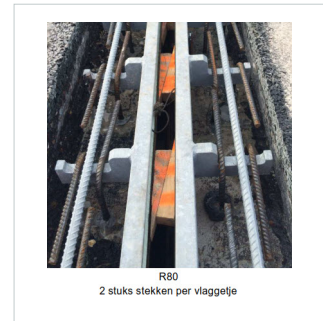
XTend R80 in uitvoering